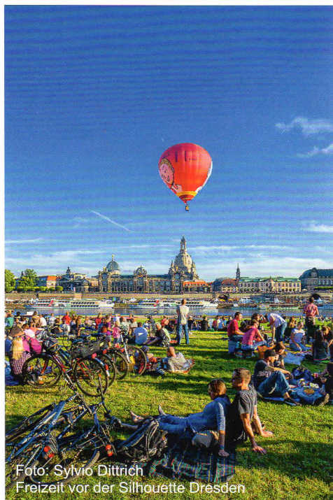
Freizeit vor der Silhouette Dresden