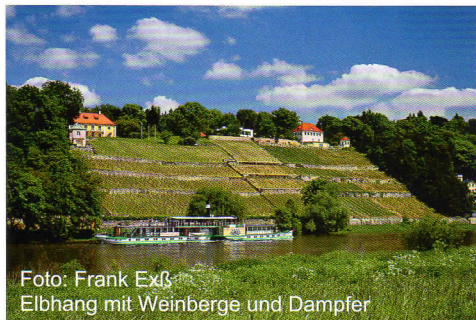
Elbhang mit Weinberge und Dampfer